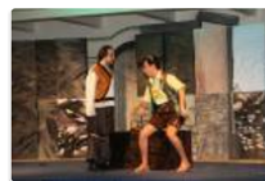
Die Zauberflöte/ Festival am Semmering