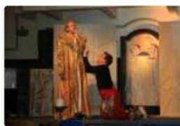
Die Zauberflöte/ Festival am Semmering