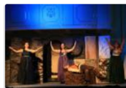
Die Zauberflöte/ Festival am Semmering